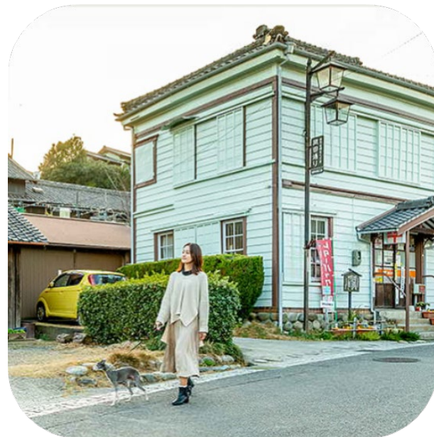
岡田の古い町並み