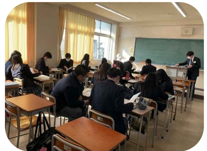
知多市で実施されているゼロカーボン授業の様子