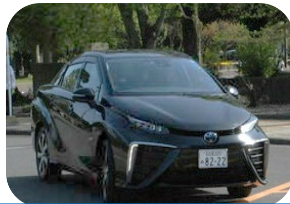
知多市の公用車として導入しているMIRAI