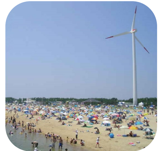
新舞子ブルーサンビーチ