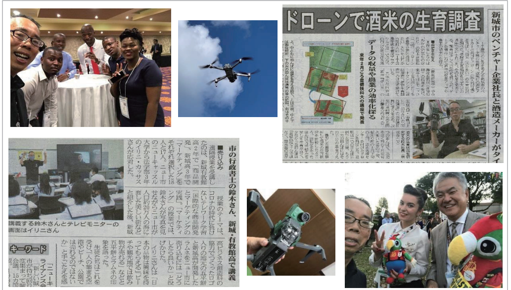
写真【左上】南アフリカでの国際会議 【右下】友好都市との交流