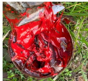
投棄されていた産業用のペンキ