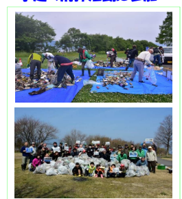
湖岸緑地志那1にて清掃

環境写真展の開催 「コハクチョウと仲間たち」と「水鳥飛来地の 環境問題」をテーマに写真展を定期開催