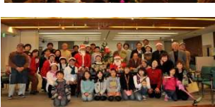
クリスマスイベント