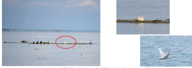
守山市 野洲川河口中洲 11月15日 撮影

今シーズン(2023-2024)の飛来状況 野洲川河口へ初飛来 幼鳥1羽(2023.11.14)