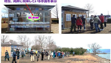
草津 志那湖岸と草津水鳥観察所

見学に来る方へ水鳥観察の支援 「水鳥一覧」や掲示図にて観察のポイントを説明 スコアを使って観察を行う 現在、湖岸に飛来している水鳥を表示