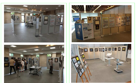
水生植物公園水の森にて開催

環境写真展の開催 「コハクチョウと仲間たち」と「水鳥飛来地の 環境問題」をテーマに写真展を定期開催