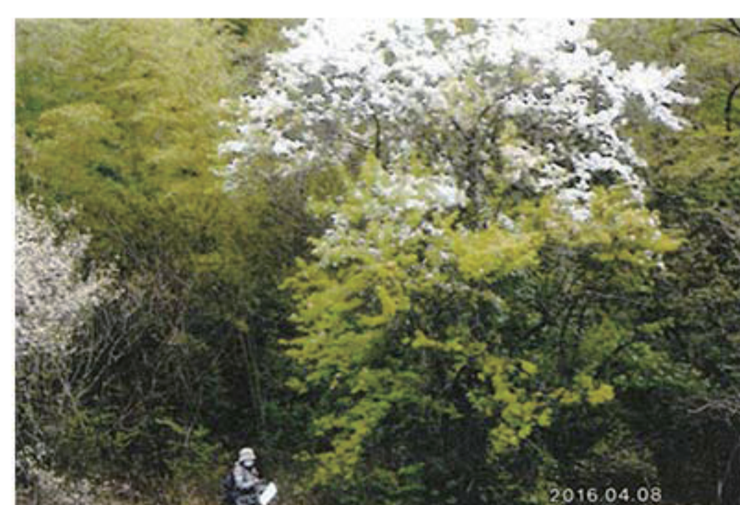
発見当時のマメナシ

犬山市のため池（朝日池、宮裏池）で発見した絶滅危惧種マメナシの自生地の保全活動を行なっています。年1回マメナシ観察会を開催しています。 「マメナシサミットinこまき」で活動を発表しました。