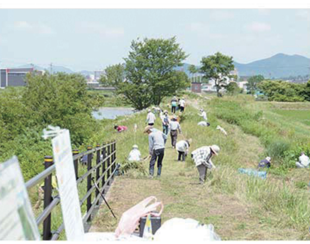
草刈りイベントの様子