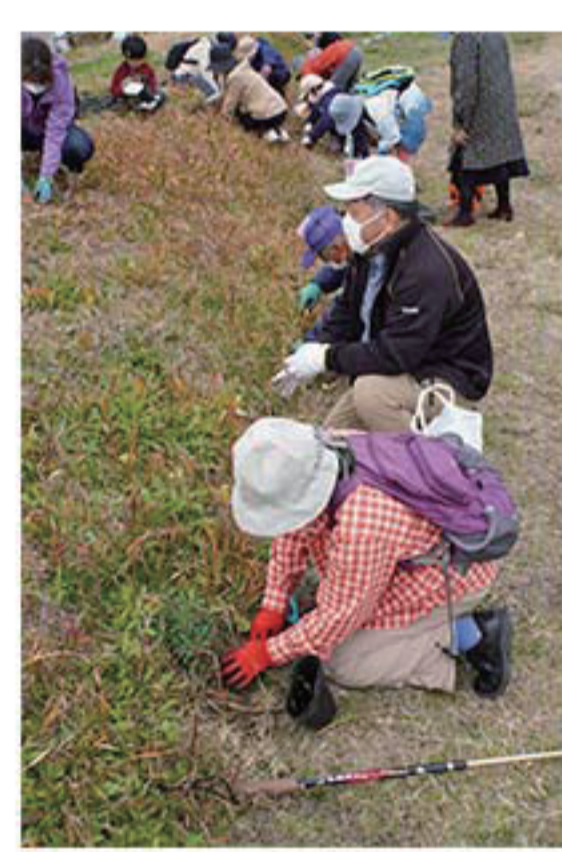
移植イベントの様子